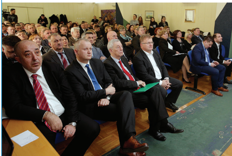
Održan 2. Obrtnički forum - obrtništvo Zagrebačke županije u gradu Zaprešiću (str. 6-8)

Fiskalizacija za paušaliste - blagajne od 01.07.2017. (str. 16-17)