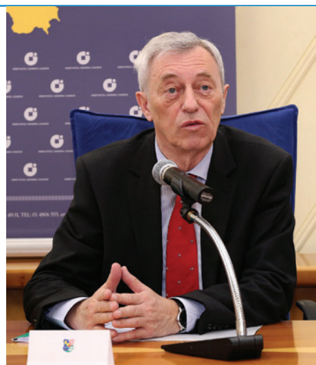
Intervju sa županom Zagrebačke županije Stjepanom Kožićem (str. 10-11)