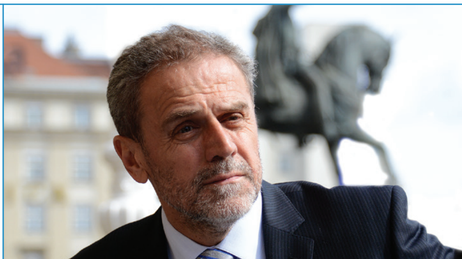
Intervju s gradonačelnikom grada Zagreba Milanom Bandićem (str. 2-5)